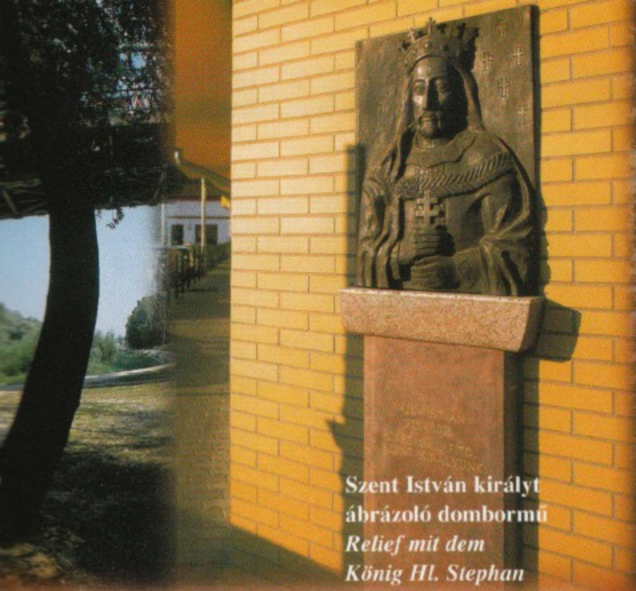
Szent István királyt ábrázoló dombormű Relief mit dem König Hl. Stephan